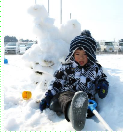
かわいい雪だるまと一緒に