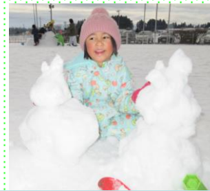
雪遊び もも組(3歳児)