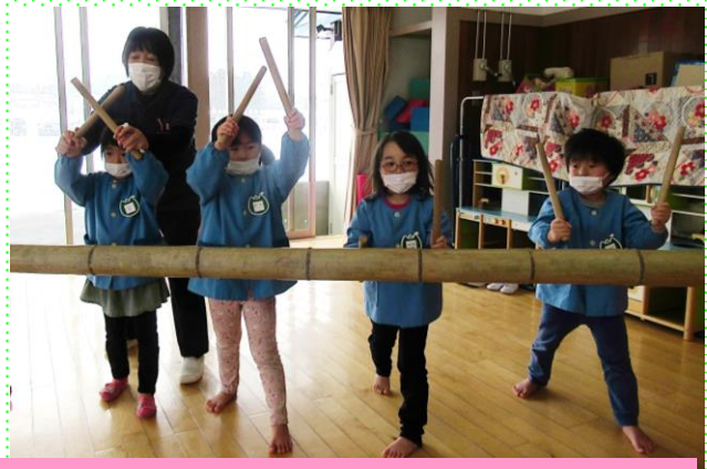
竹ばやし 竹を打ってみました みどり組 (4歳児)