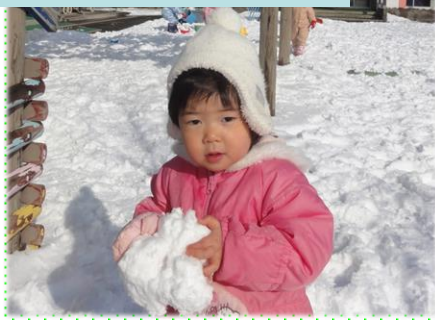
雪遊び みかん組(1歳児)