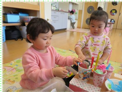
おいしいものができました。「いただきます」あか組 (2歳児)