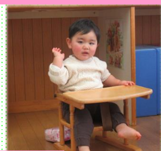
お名前を呼ばれて、手をあげてお返事が上手です。みるく組 (0歳児)