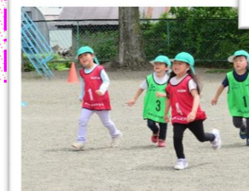
一生懸命ボールを追いかけます!! ～みどり組4歳児～