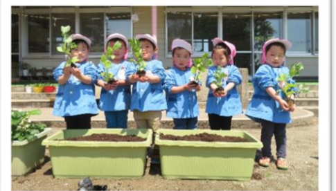
そら豆植えたよ!～もも組3歳児～