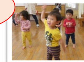
エビカニクス元気に踊ります! ～おれんじ組2歳児～