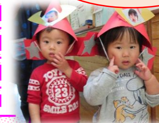
ステキな兜をもらったよ ～あか組1歳児～