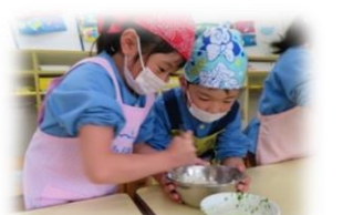
よもぎ饅頭づくり ～きいろ組5歳児～