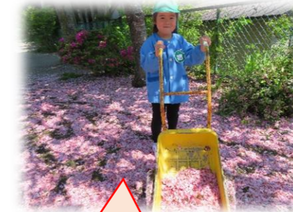
桜のじゅうたん きれいだな～