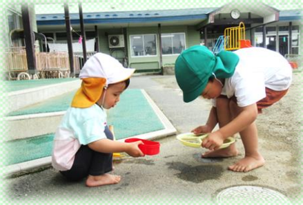
みかん②組(1歳児)みどり組(4歳児) 「お水を運ぶ時は、こうやって・・・」