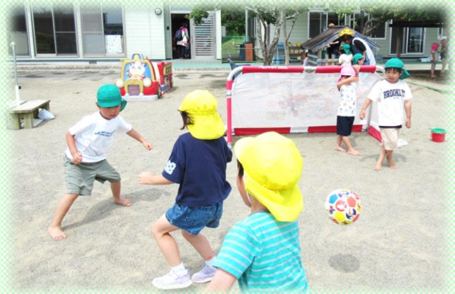
サッカー大好き! もも組、みどり組力を合わせて、きいろ組に挑戦!