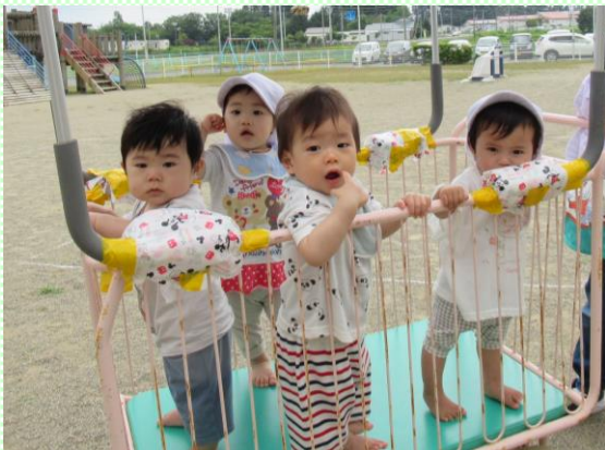
みるく組(0歳児)「お外、気持ちいいね」