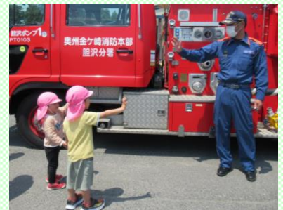
もも組(3歳児) 「バイバイ」「また来てね」