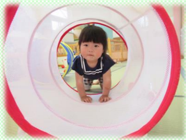
みかん②組(1歳児) トンネル遊び、冒険だね