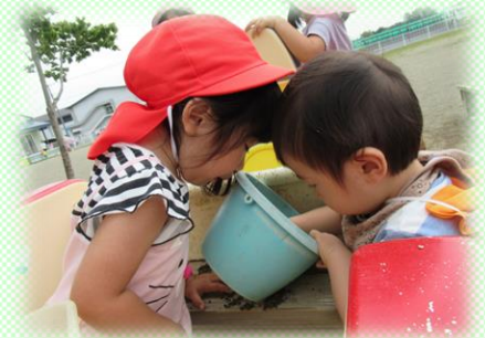
砂場遊び 「これ、見付けたの!」「見せて」