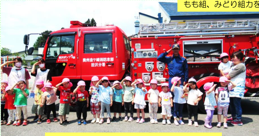
もも組(3歳児)「はい、敬礼」かっこいいね!