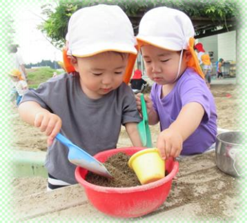
みかん②組(1歳児)砂場遊び 「おいしいの つくろう」